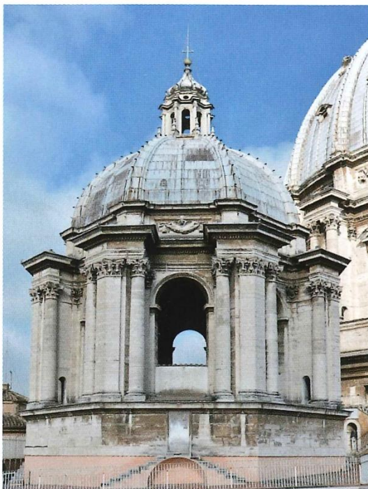
Vista de la Cúpula de la Capilla Clementina antes de la restauración.

Fabbrica di San Pietro ha iniciado la restauración de la cúpula externa de la Capilla Clementina.